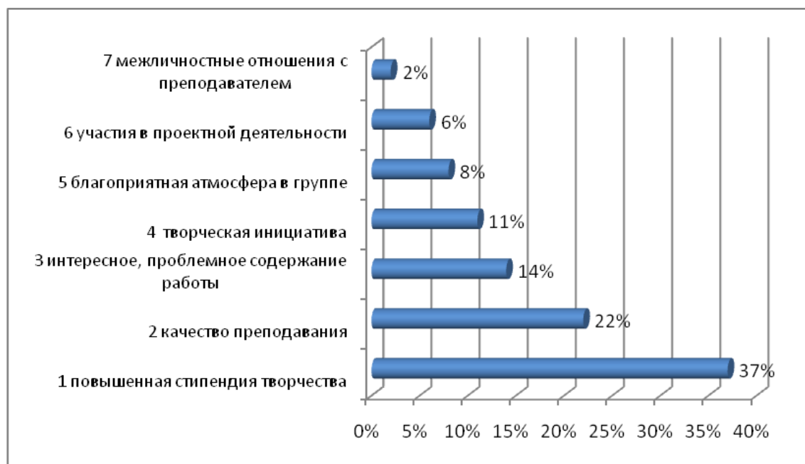
Рис. 3 Факторы мотивации творческой деятельности студентов

Результаты представлены в диаграмме «Факторы мотивации творческой деятельности студентов».