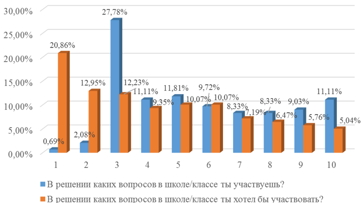
Рисунок 3 - Участие детей в решении вопросов в школе

Также респондентам задавались вопросы относительно реальных и ожидаемых практик участия в школьной повседневности. Участники исследования продемонстрировали свою заинтересованность в решении вопросов организации школьного питания, выбора школьной формы, а также участия в спортивных и общественных мероприятиях/социальных акциях. Реже дети хотят участвовать в выборе актива класса, вопросах разрешения конфликтов и учебных вопросах. (см.рисунок 3).