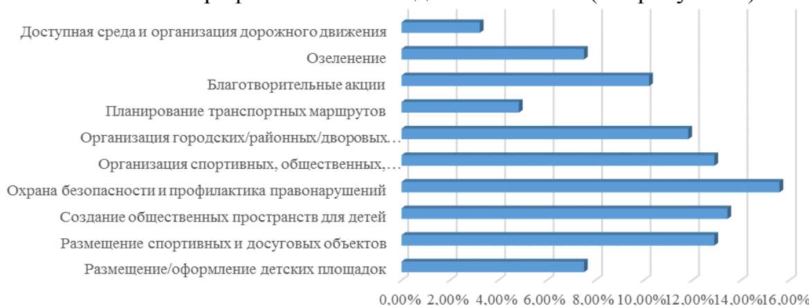
Рисунок 4 - Распределение ответов на вопрос «На решение каких вопросов в своем городе / районе проживания ты хотел(а) бы влиять?»

правонарушений, создание общественных пространств для детей, вопросы размещения спортивных и иных важных для детей объектов (см. рисунок 4).