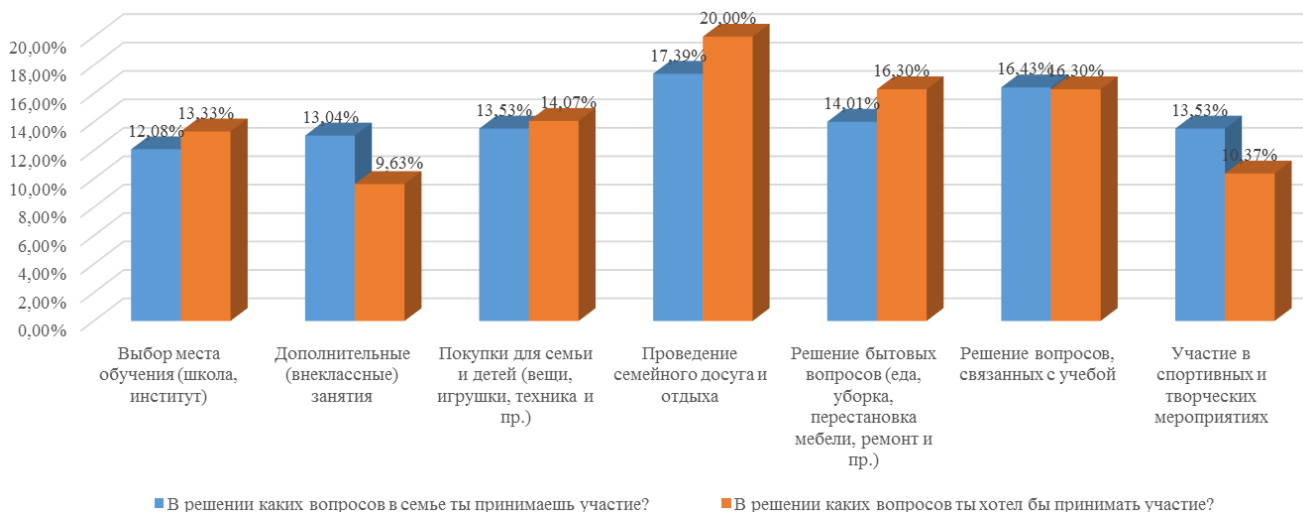
Рисунок 1– Участие детей в решении семейных вопросов

Во втором вопросе дети уточняли, в решение каких вопросов они вовлечены в своей семье (см. рисунок 1).